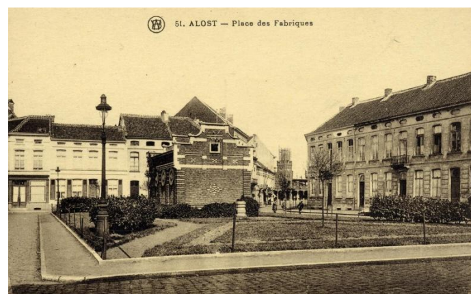
1: De Botanikken Hof