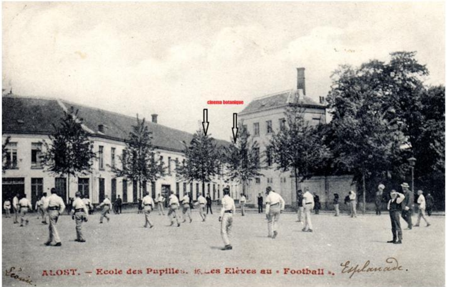
2: Esplanadeplein met tabaksfabriek De Lepeleer, later cinema Botanique (tussen de pijlen)